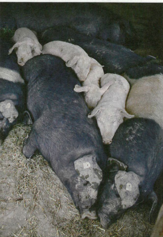
Ein paar Wochen nach dem Umzug hat jedes Schwein seinen Platz gefunden: Wenn es genug Platz und Futter gibt, kümmern sich Schweine gut umeinander.

Wir beschließen, den Zaun, der die neuen von den alten Schweinen trennen sollte, abzubauen und den doppelten Stromzaun für einige Tage auszuschalten, bis sich die neuen Schweine an das Gelände gewöhnt haben. Zur Sicherheit läuft um das Gehege noch ein Maschendrahtzaun, der die Schweine am Ausreißen hindert.