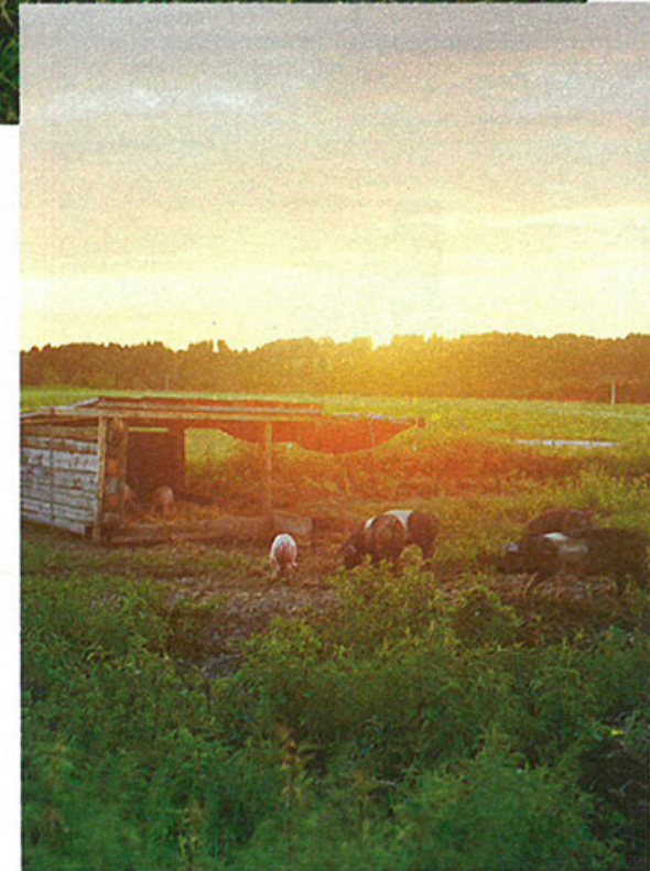
Das erste Suhlen klappt noch nicht perfekt, macht aber jedes Schwein sehr glücklich. Weidehaltung ebenfalls – die ist aber sogar auf Bio-Höfen selten.